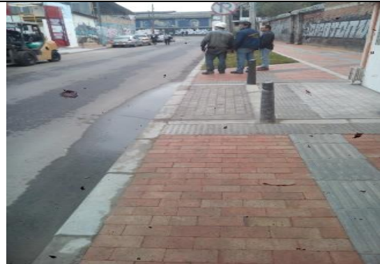
Falta demarcación y selladle arena de sello