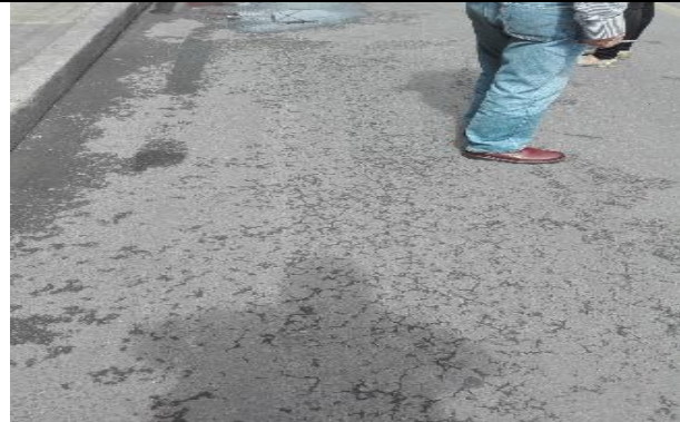
Falla carpeta (piel de cocodrilo) 50%