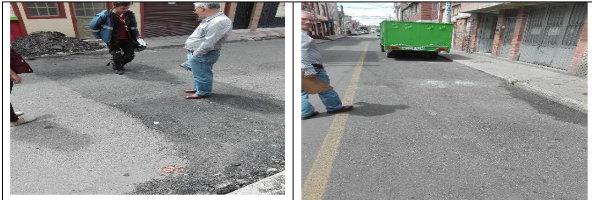
Perdida de agregado en la carpeta asfáltica 60%