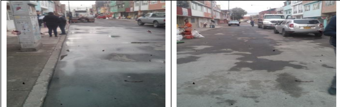
Empozamiento a lo largo de la vía y Falta demarcación.