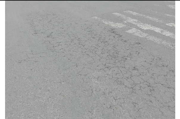
Falla carpeta (piel de cocodrilo incipiente) costado occidental