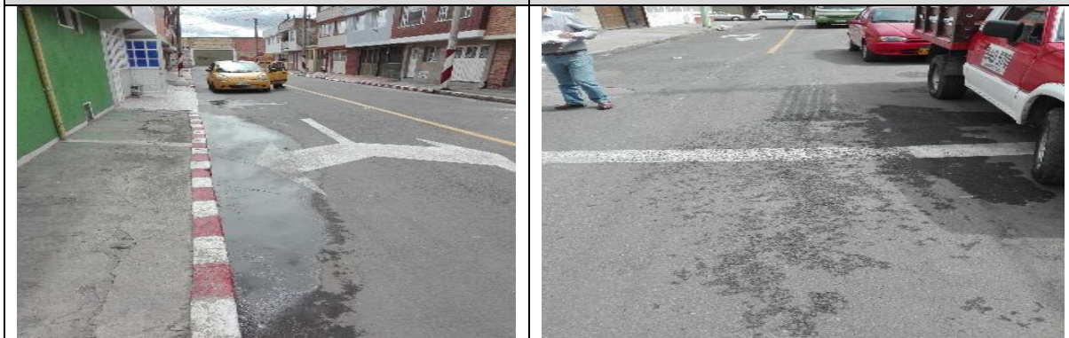
Empozamiento costado sur