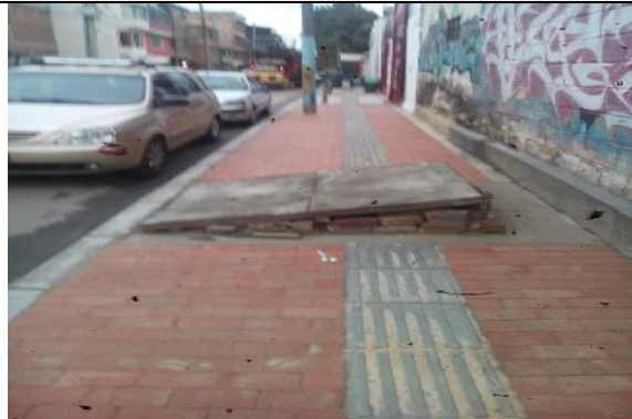
Trasformador CODENSA sin reubicar