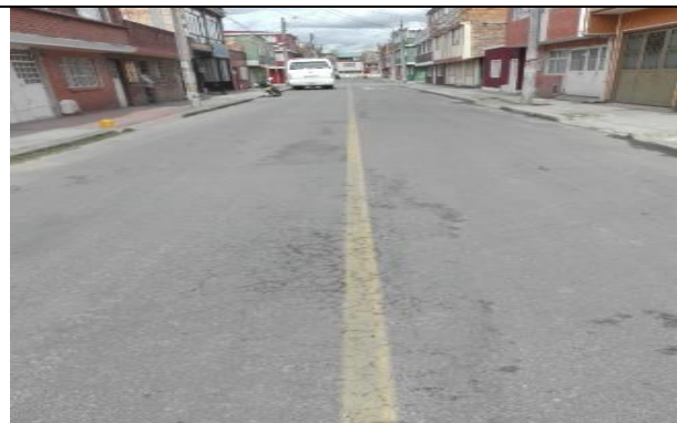
Falla carpeta (piel de cocodrilo) 50%