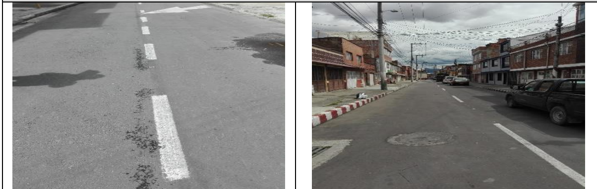
Falla carpeta (piel de cocodrilo incipiente) 3,7x0,2